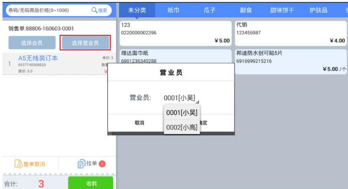
V 如图 4-1-7